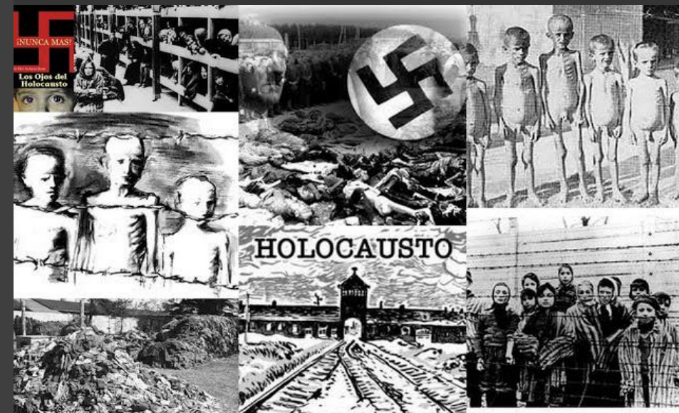
AND STILL CATHOLICS CLAIM HITLER WAS AN ATHEIST

Попробую поразмышлять над этим вопросом.