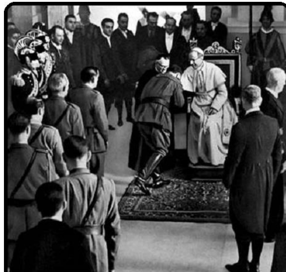
Fascist Spain's Catholic Generals kissing the ring of Pius XII, their "Supreme Pontiff" in 1939

Поддержка Ватикана помогла Гитлеру расширять преступную политику против евреев и душить любой протест в зародыше. Это удавалось: чем набожней был католик, тем легче он управлялся и воспринимал как справедливые любые антиеврейские действия нацистов. Миллионы немецких католиков пополнили нацистскую партию, уверенные в том, что если она пользуется безоговорочной поддержкой самого Папы, то встать под ее знамена – священный долг католика.