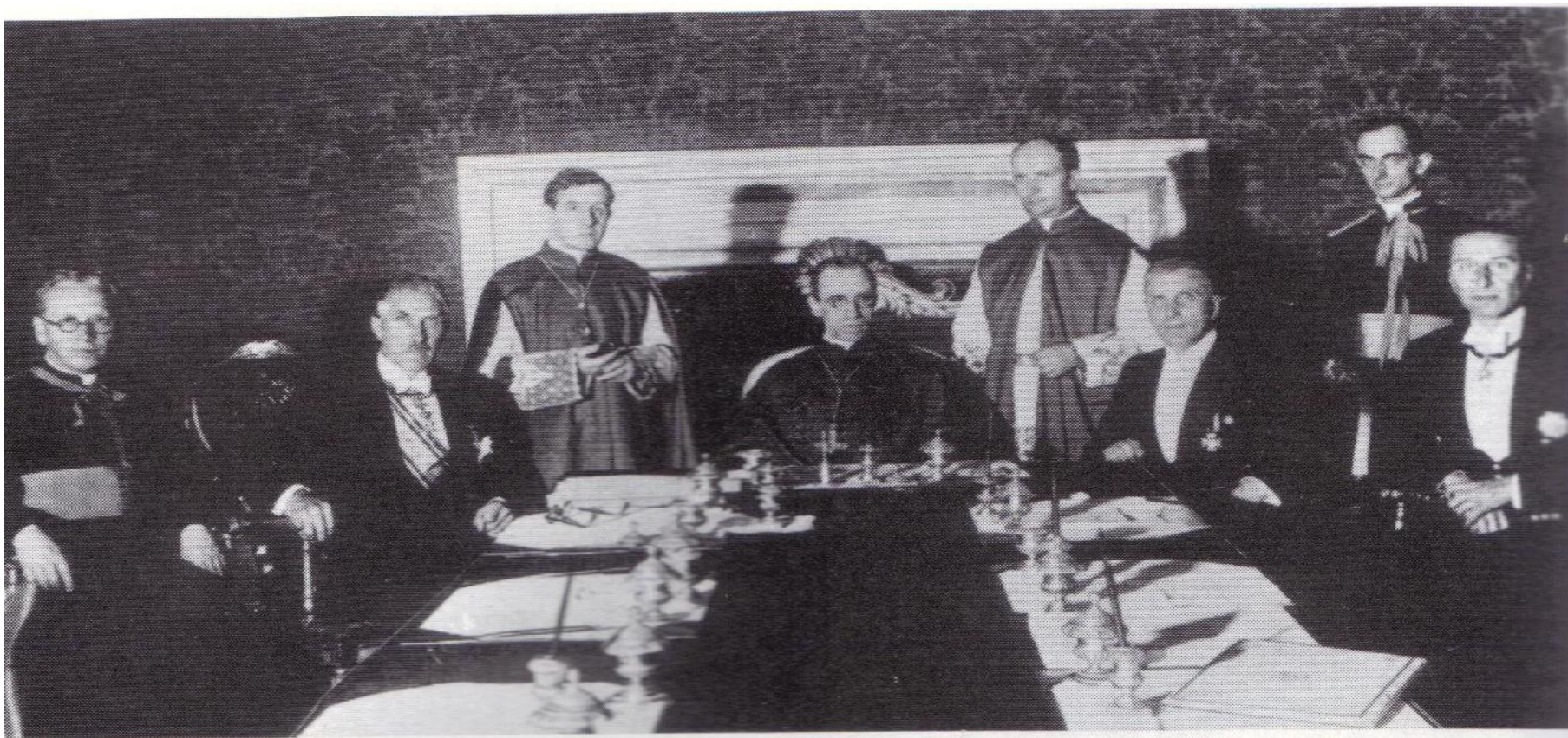
Pacelli presides over the signing of the Reich Concordat at the Vatican on July 20, 1933. Franz von Papen and Ludwig Kaas, intimate collaborator, are sitting on his right

После прихода нацистов к власти был подготовлен и 20 июля 1933 года подписан Конкордат — соглашение о взаимоотношениях между Ватиканом и новым немецким правительством.